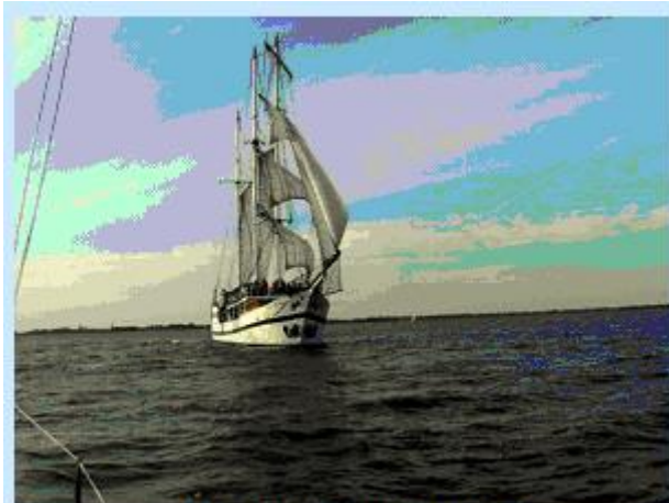
De barkentijn "Abel Tasman"

Om een uur of vijf waren we bij de Hoek van het IJ (= begin van het IJsselmeer) en hebben we het grootzeil opgezet, motor erbij omdat we toch Hoorn wilden bereiken. Dat ging prima.