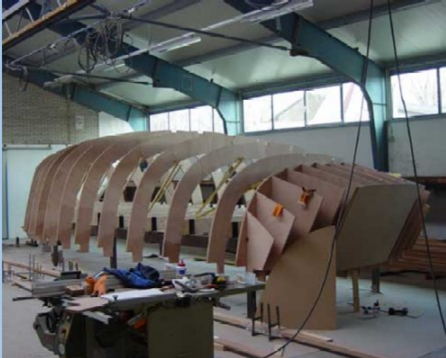
De spanten worden gezet

De eigenschappen: Ze hebben prima zeileigenschappen en bieden comfort, luxe en ruimte. Verder volgen ze het 'single handed' concept, dat inhoudt dat de schipper, desnoods alleen, alles vanuit de kuip kan bedienen. Je kunt er perfect langere tijd comfortabel op verblijven, wat C-Yacht schepen uitermate geschikt maakt voor langere zeilreizen. C-Yacht schepen worden in serie geproduceerd, maar wel met keuzemogelijkheden zodat ieder schip een individuele invulling krijgt en iedereen zijn persoonlijke touch aan zijn eigen jacht kan geven. Inmiddels zijn er alweer drie modellen C-Yacht schepen ontworpen en in productie, de C-Yacht 10.40, C-Yacht 11.00 en de C-Yacht 11.30 DS. Elk model met een eigen identiteit en eigenschappen, maar met de basisuitgangspunten van een C-Yacht.