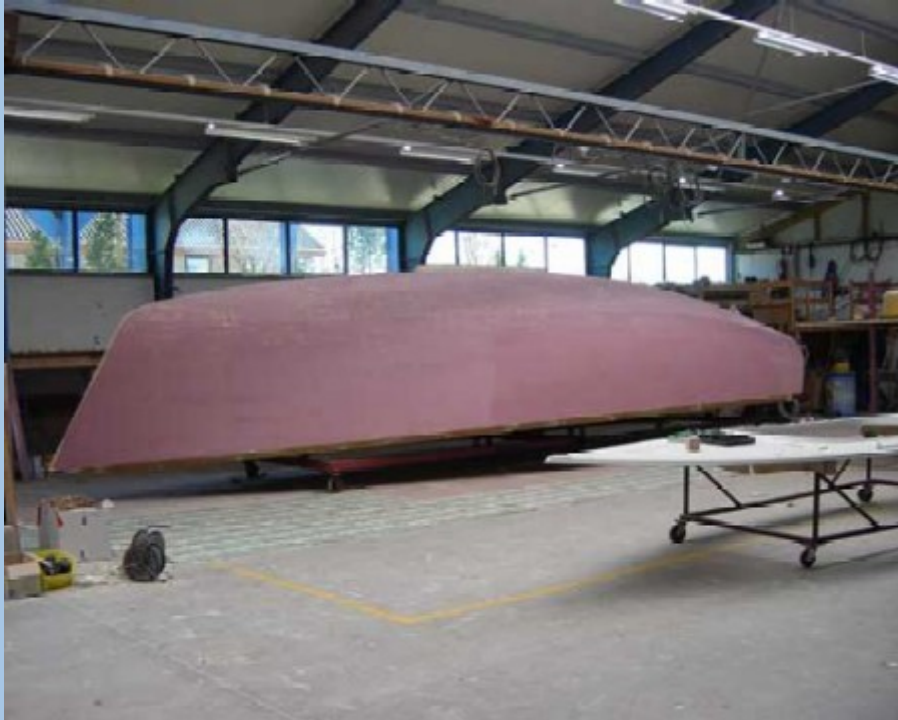
De vorm van de romp

Niet iedereen denkt in 3-D. Daarom besloot Zaadnoordijk Yachtbuilders dat het lijnenplan van de 12.50 vertaald moest worden naar een plaatje dat goed te begrijpen was voor hun klanten.