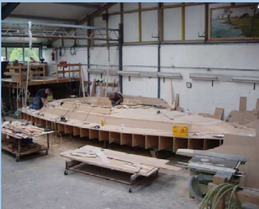
Het model van het dek

Het zeilplan is gemaakt om te presteren en is goed bedienbaar. Zo zijn de zeilen bedienbaar vanuit de kuip, zodat je niet het voordek op hoeft om een zeil te hijsen of te strijken. Op het moment dat dit artikel werd geschreven, werd er nog druk overlegd over de deklay-out voor onder andere de lieren. De kuip en kuipbanken worden voorzien van teakhout. De boot wordt bestuurd met een met leer overtrokken stuurwiel en aangedreven door een 4 cilinder Yanmar motor van 56 pk. Het interieur van de boot wordt voorzien van fraai afgewerkt teakhout. In het achterschip komt een zeer ruime eigenaarshut of, naar keuze, twee separate hutten.