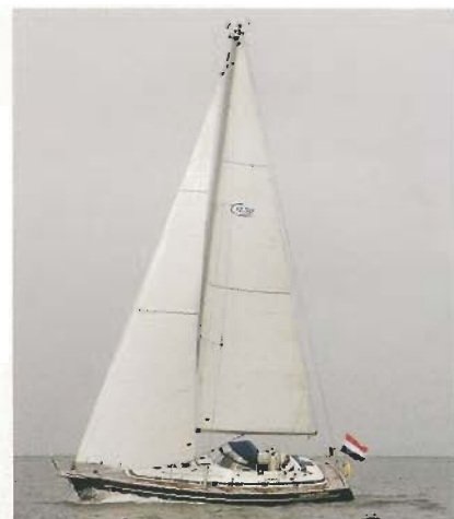
Smalle hoge zeilen met een relatief kleine voordriehoek. De tuigage is nog net fractioneel, voor enige mastbuiging.

Op de dekbeslagen is niet bezuinigd, maar de plaats van de genuaschootlieren vinden we onhandig, te ver naar buiten. De uitvoering van de tuigage is eenvoudig, maar doordacht. Het denkwerk is een samenspel tussen ontwerper, werf en De Vries Sails, sinds jaar en dag huiszeilmaker voor Zaadnoordijk. Enkele decennia geleden was een dergelijk groot schip voor twee personen meestal niet goed hanteerbaar. Vooral vanwege de grote voorzeilen. Op de C-Yacht 12.50 blijkt het gedeeltelijk doorgelatte grootzeil in combinatie met de high aspect-fok een prima